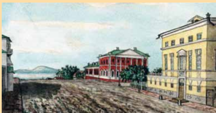
Вид Никольской улицы в Саратове (ныне ул. Радищева). Рисунок А. Н. Минха. 1867 г.