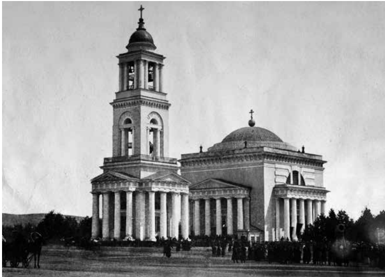
Александро-Невский собор в Саратове.

Журнал «Волга–XXI век» зарегистрирован МПТР РФ, свидетельство ПИ № 77-16080 от 6 августа 2003 года.