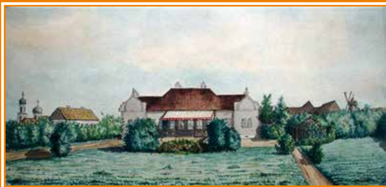
Дом А.Н. Минха в с. Колено Аткарского уезда. Рисунок А.Н. Минха, 1864 г.