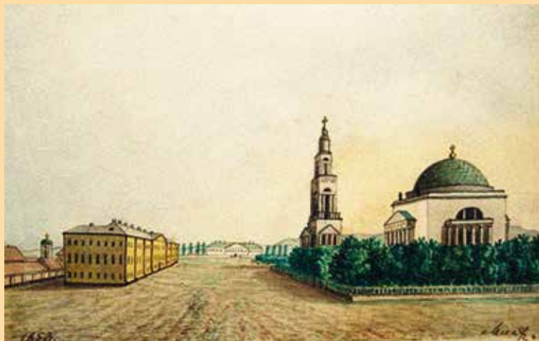
Соборная площадь в центре г. Саратова. Собор Александра Невского. Рисунок А. Н. Минха