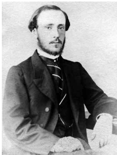
Аткарский уездный предводитель дворянства В.В. фон Гардер. 1863 г.

ей отдал отец Воеводчино 20 , и помещица живёт здесь каждое лето, переезжая на зиму в Саратов. Воеводчино приходом в Белгазу-Маматовку 21 .